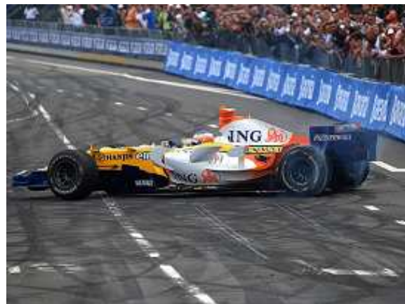
Bavaria City Racing Rotterdam

Het zijn slecht twee voorbeelden uit de vele honderden evenementen die zich op sport richten. De Sport Evenementen Monitor biedt u de helpende hand. De monitor biedt informatie over alle sportevenementen in Nederland.