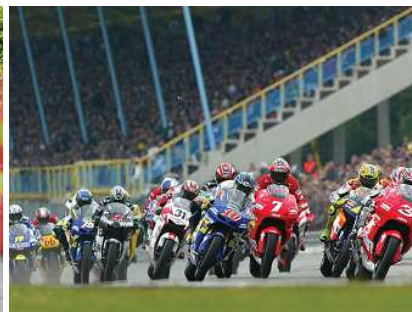
A-style Dutch TT Assen

'Respons Sport Evenementen Monitor: onmisbaar voor iedereen in sponsorland!'