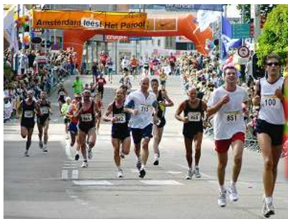
Dam tot Damloop