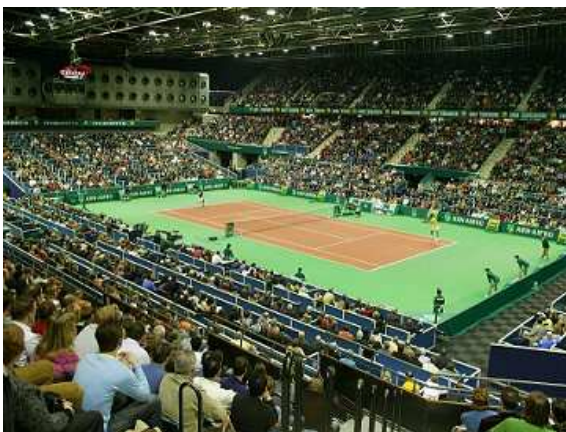
ABN Amro tennis tournament

Sportevenementen nemen daarvan het grootste deel voor hun rekening. Volgens cijfers van het NOC*NSF gaat een steeds groter deel van de 230 miljoen euro die jaarlijks aan sportsponsoring wordt besteed, naar sportevenementen. Het is dan ook niet verwonderlijk dat steeds meer organisaties behoefte hebben aan volledige en onafhankelijke informatie over de sportevenementenmarkt. Om die reden voert Respons continu onderzoek uit naar de markt van sportevenementen en worden de resultaten één keer per jaar, in de maand maart, gepubliceerd in de Sport Evenementen Monitor en is er een online versie verkrijgbaar die altijd up to date is.