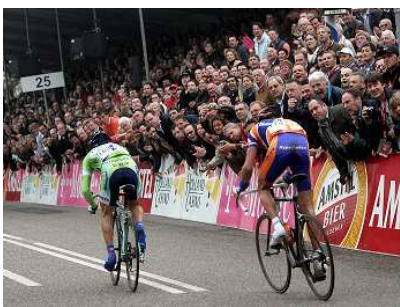
Amstel Gold Race

Bestellen kan heel eenvoudig, middels het zojuist genoemde bestelformulier. U vult het in, ondertekent het en faxt ons, dan maken wij alles snel in orde, zodat u dezelfde dag nog toegang hebt tot de Online Sport Monitor.